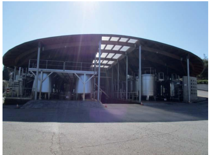
Foto effettuata per l'aggiornamento della scheda in sede di Variante al PS 2016