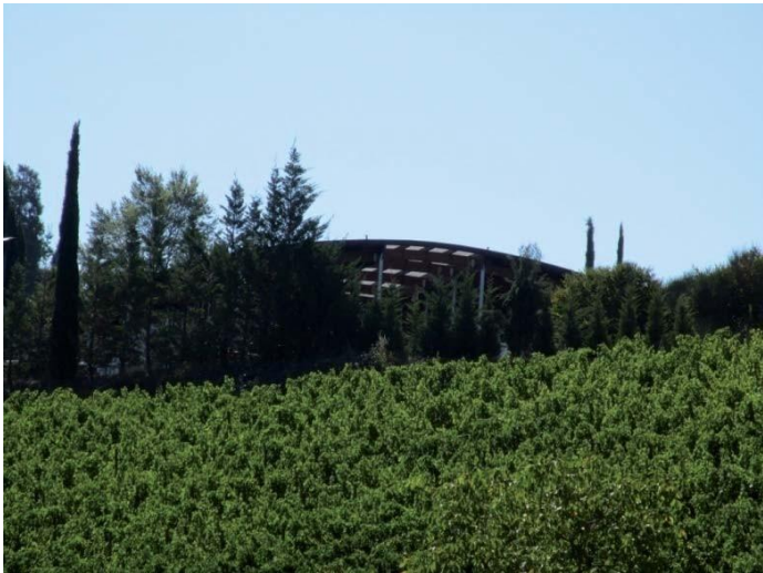
Foto effettuata per l'aggiornamento della scheda in sede di Variante al PS 2016