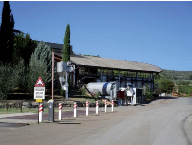
Foto effettuata per l'aggiornamento della scheda in sede di Variante al PS 2016